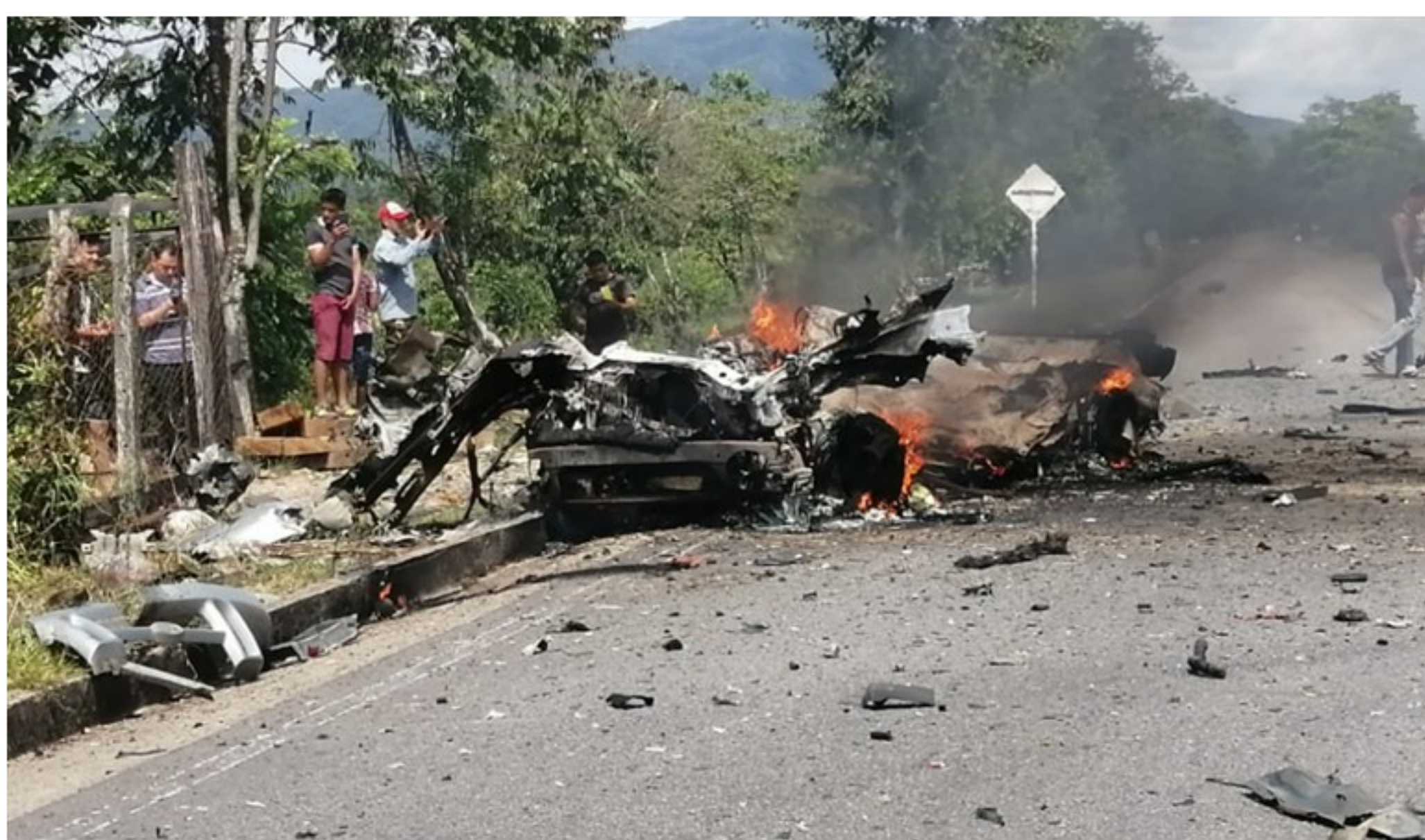
El gobernador de Boyacá, Carlos Andrés Amaya, condenó el atentado terrorista..

Los uniformados fueron trasladados al hospital de Cubará, uno de ellos en delicado estado de salud.