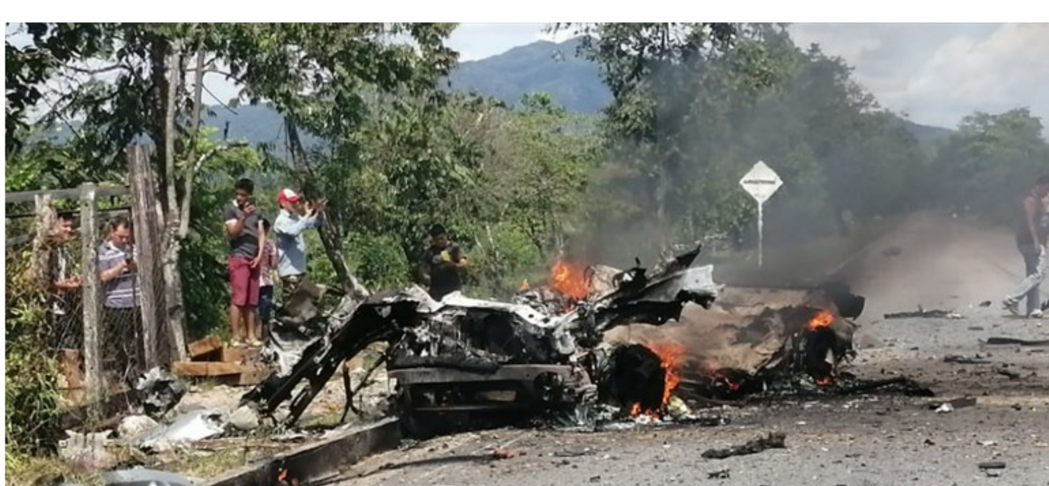
Tres soldados permanecen en el hospital de Cubará, Boyacá.

Según el viceministro Francisco José Chaux, el ataque terrorista puso en riesgo la vida de niños, mujeres, líderes sociales y defensores de derechos humanos.