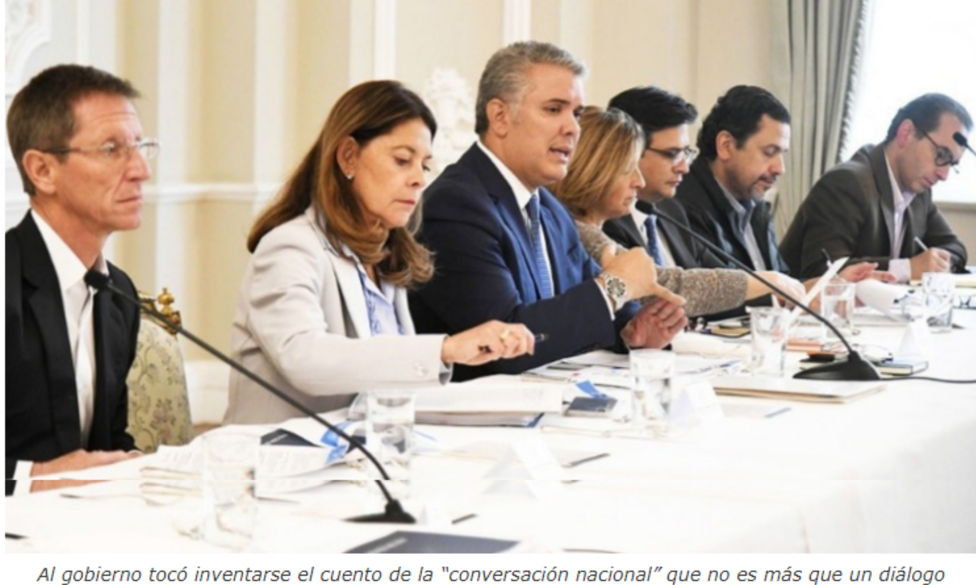
Al gobierno tocó inventarse el cuento de la "conversación nacional" que no es más que un diálogo de sordos, con los mismos y las mismas.

Este es un espacio de expresión libre e independiente que refleja exclusivamente los puntos de vista de los autores y no compromete el pensamiento ni la opinión de Las2Orillas.