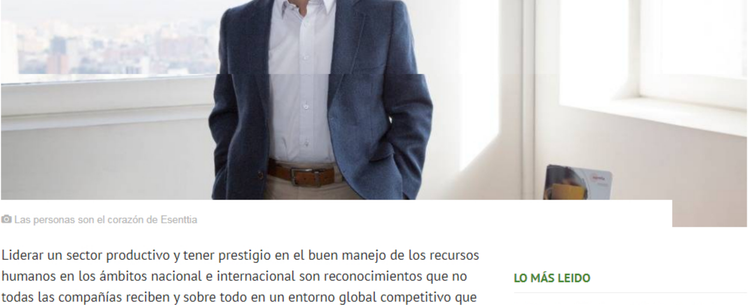
Las personas son el corazón de Esenttia

En esta compañía colombiana, filial del Grupo Empresarial Ecopetrol , el capital humano es fundamental en la consecución del éxito de su operación en los mercados nacional y latinoamericano de la fabricación de plástico y la transformación sostenible de la sociedad.