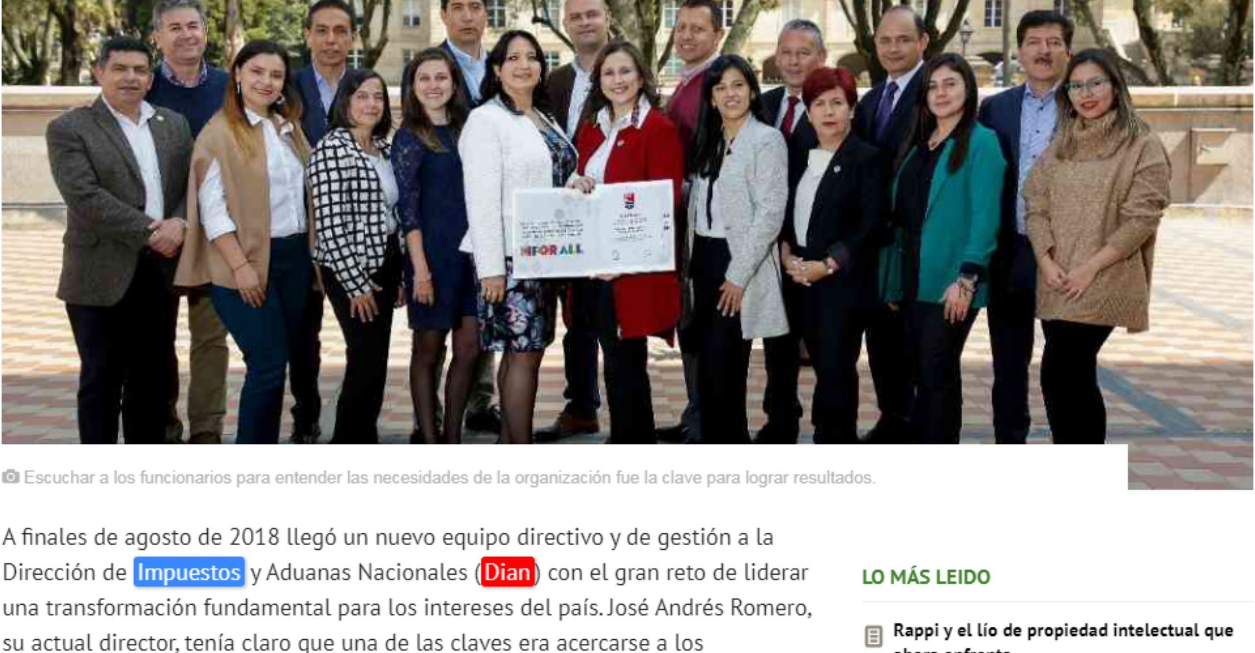
Escuchar a los funcionarios para entender las necesidades de la organización fue la clave para lograr resultados.

Con la idea de renovar integralmente la entidad, la Dian logró lo que pocas organizaciones públicas pueden: una calificación muy satisfactoria en varios de los índices que mide Great Place to Work.