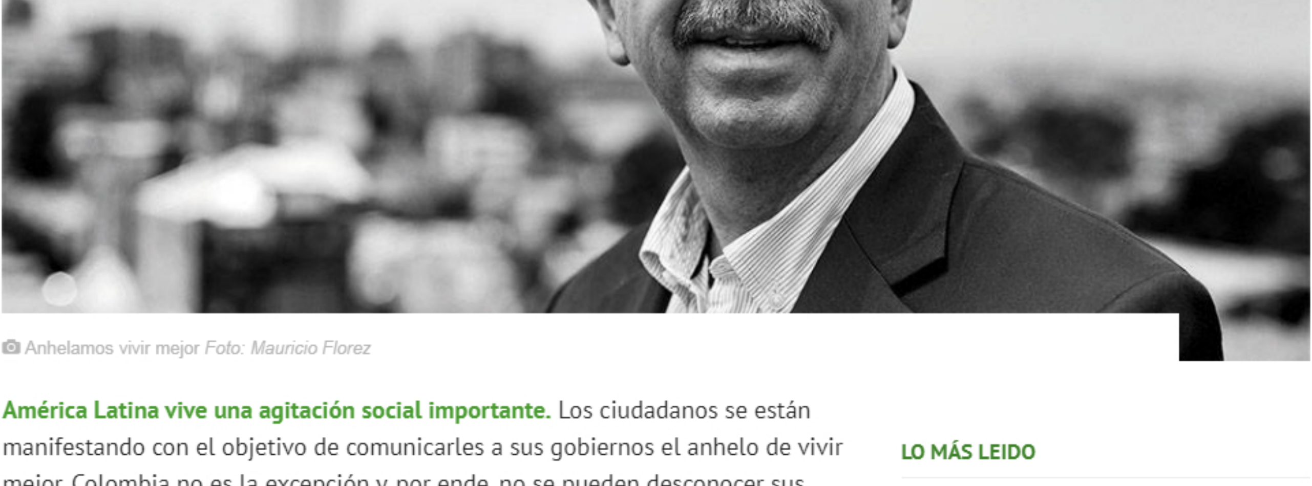
Anhelamos vivir mejor

Las empresas son actores fundamentales para hacer de Colombia un mejor país. Si sus 22 millones de trabajadores sienten que ellas responden a sus expectativas, realmente podremos progresar.