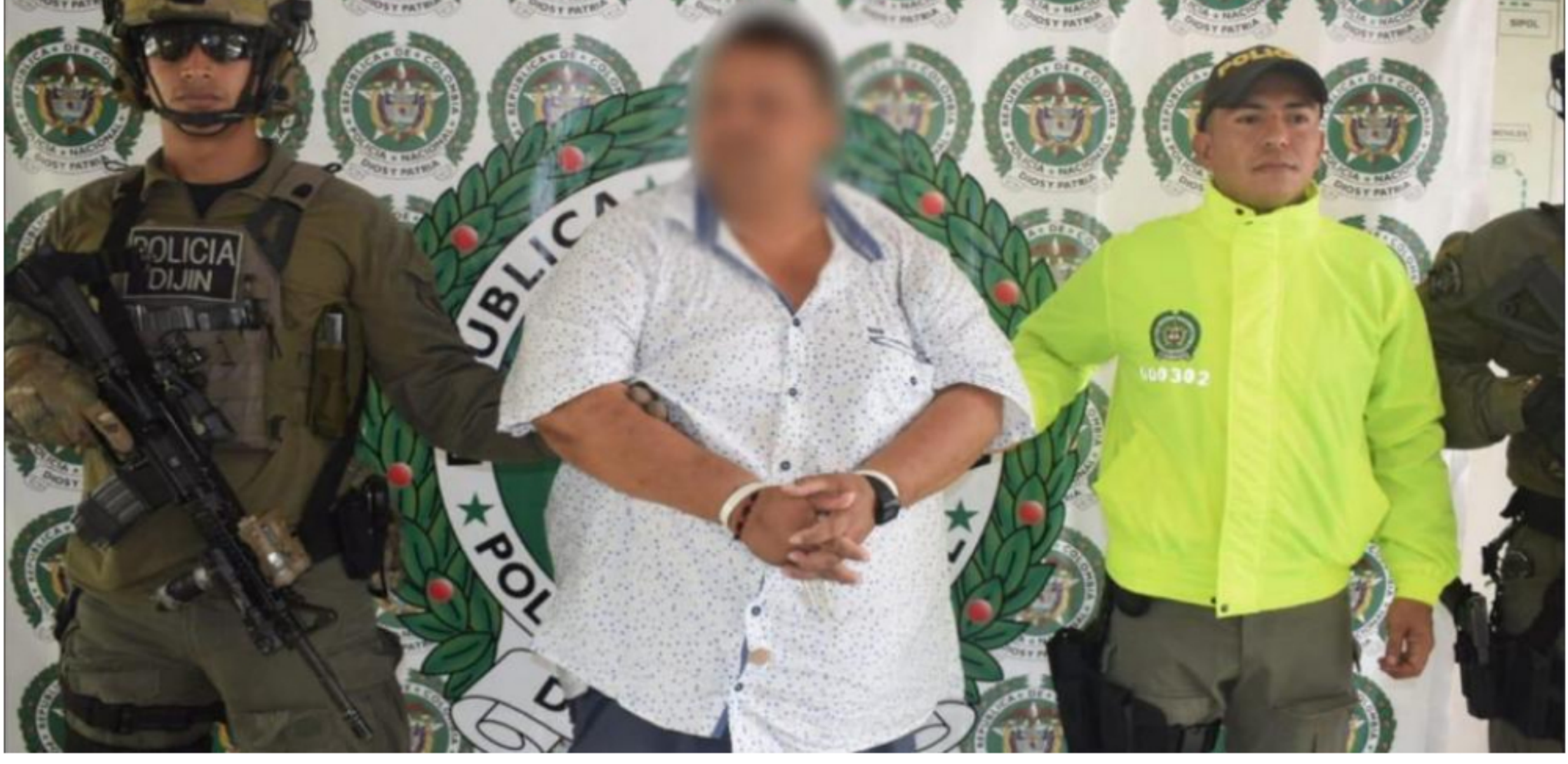
El 'Gordo Murillo' presuntamente sería el articulador de la línea estratégica ordenada por 'Pablito', jefe militar del Eln.

RELACIONADOS: Eln | ARAUCA | DIJIN | POLICÍA | ALIAS PABLITO