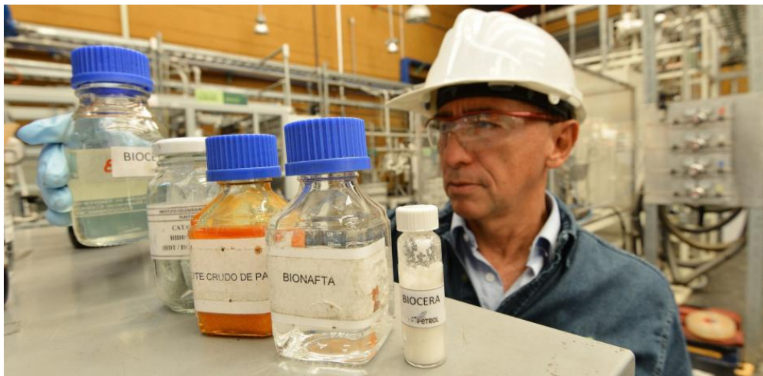
En el proyecto, que impulsa el biocomercio en Santander, se invertirán unos $17.500 millones, incluidos recursos de regalías.