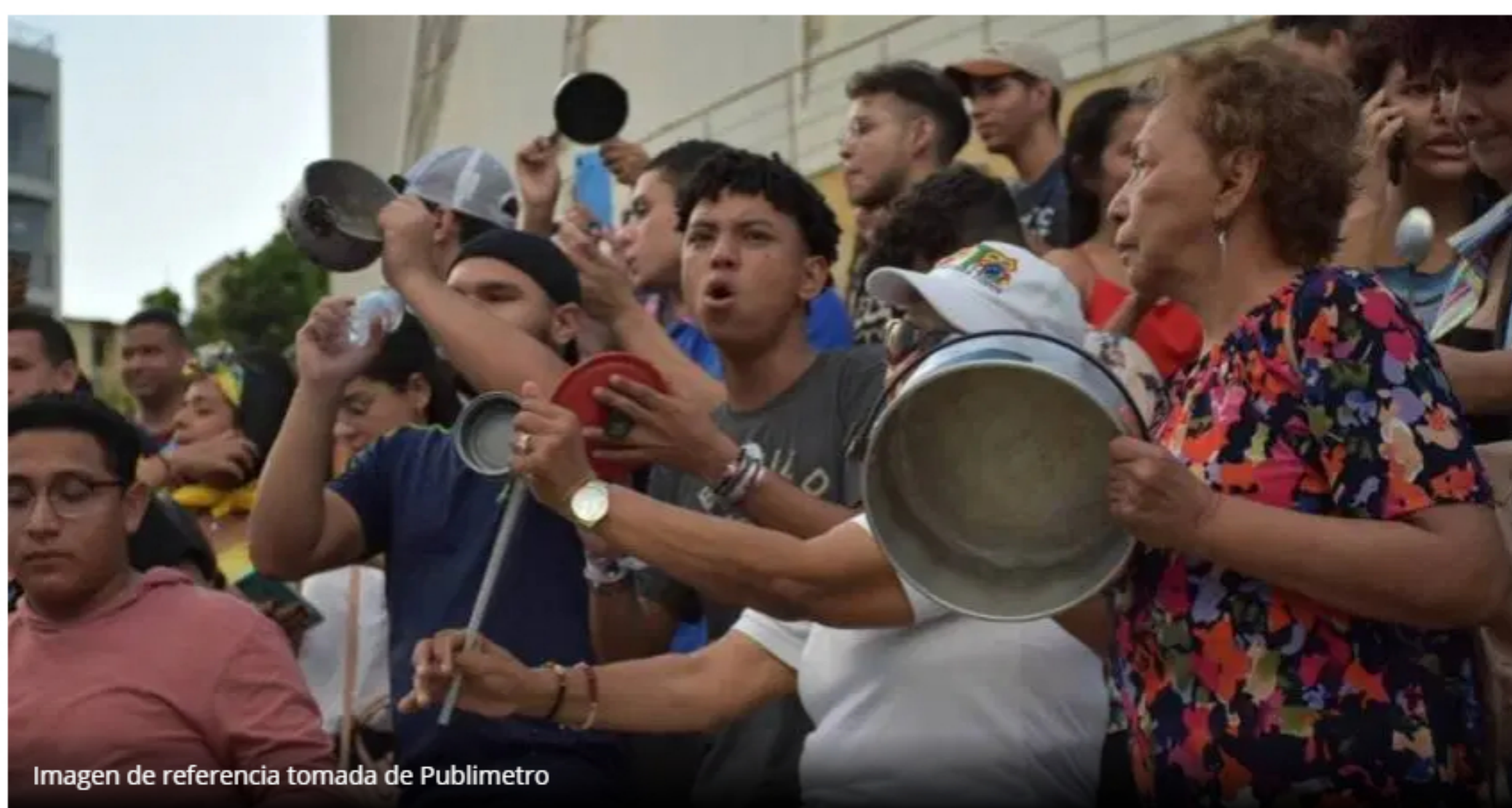
Imagen de referencia tomada de Publimetro

Fecha: 7 diciembre, 2019 Categoría: Opinión