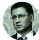
Alexander Novak Ministro de Energía ruso

"Los recortes de la Opep y sus aliados totalizarían 1,7 millones de barriles por día en el período enero-marzo y que todos los países deberán cumplir con sus compromisos".