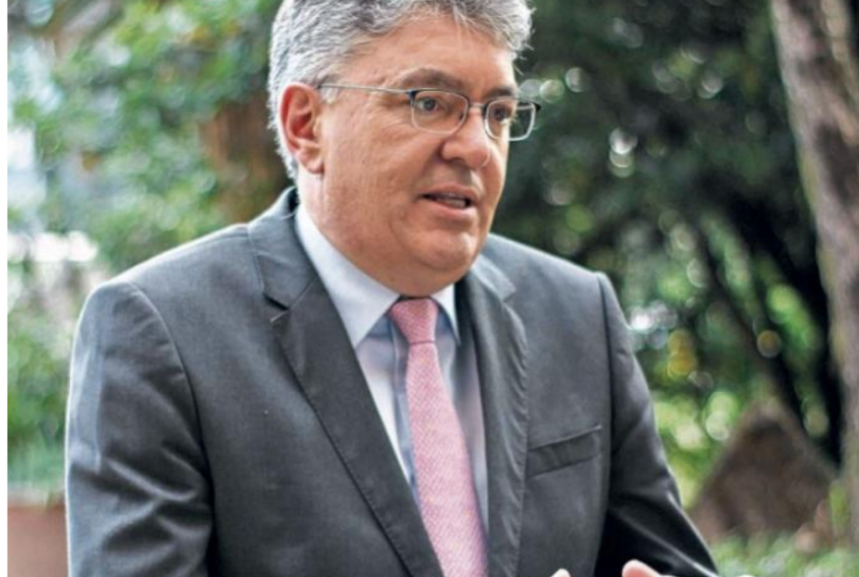
Mauricio Cárdenas Santamaría, exministro de Hacienda y Crédito Público.

POR: EFE · ABRIL 11 DE 2019 - 02:58 P.M.