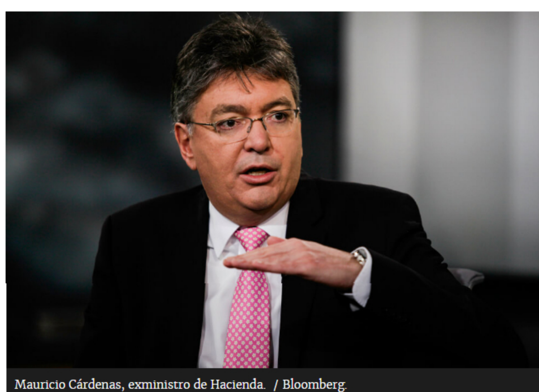
Mauricio Cárdenas, exministro de Hacienda.

El economista advierte que la reforma tributaria que se discute en el Congreso reduciría los ingresos del Gobierno en aproximadamente 1% del Producto Interno Bruto en 2022.