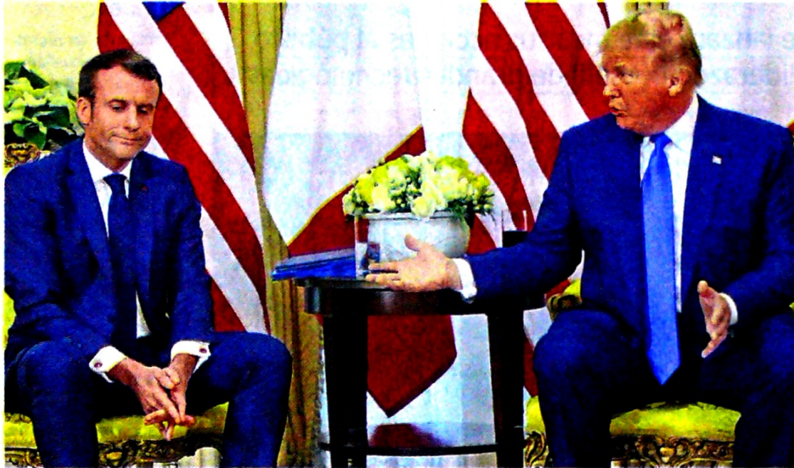
Los presidentes de Francia, Emmanuel Macron, y de EE. UU., Donald Trump, se reunieron ayer.

Esto generó una nueva tensión entre Estados Unidos y la Unión Europea, que aseguró ayer, tras conocerse la amenaza, que res-