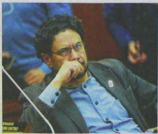
Iván Cepeda denunció que exfuncionarios de la Fiscalía interceptaron llamadas de negociadores en diálogos de paz.

"Es evidente que de ser cierta toda esta información, se pondría al descubierto una infame campaña que habría tenido por propósito entorpecer la implementación del Acuerdo Final y hacer fracasar el proceso de paz, así como obstruir el proceso de sometimiento a la justicia y la desmovilización del llamado 'Clan del Golfo'",