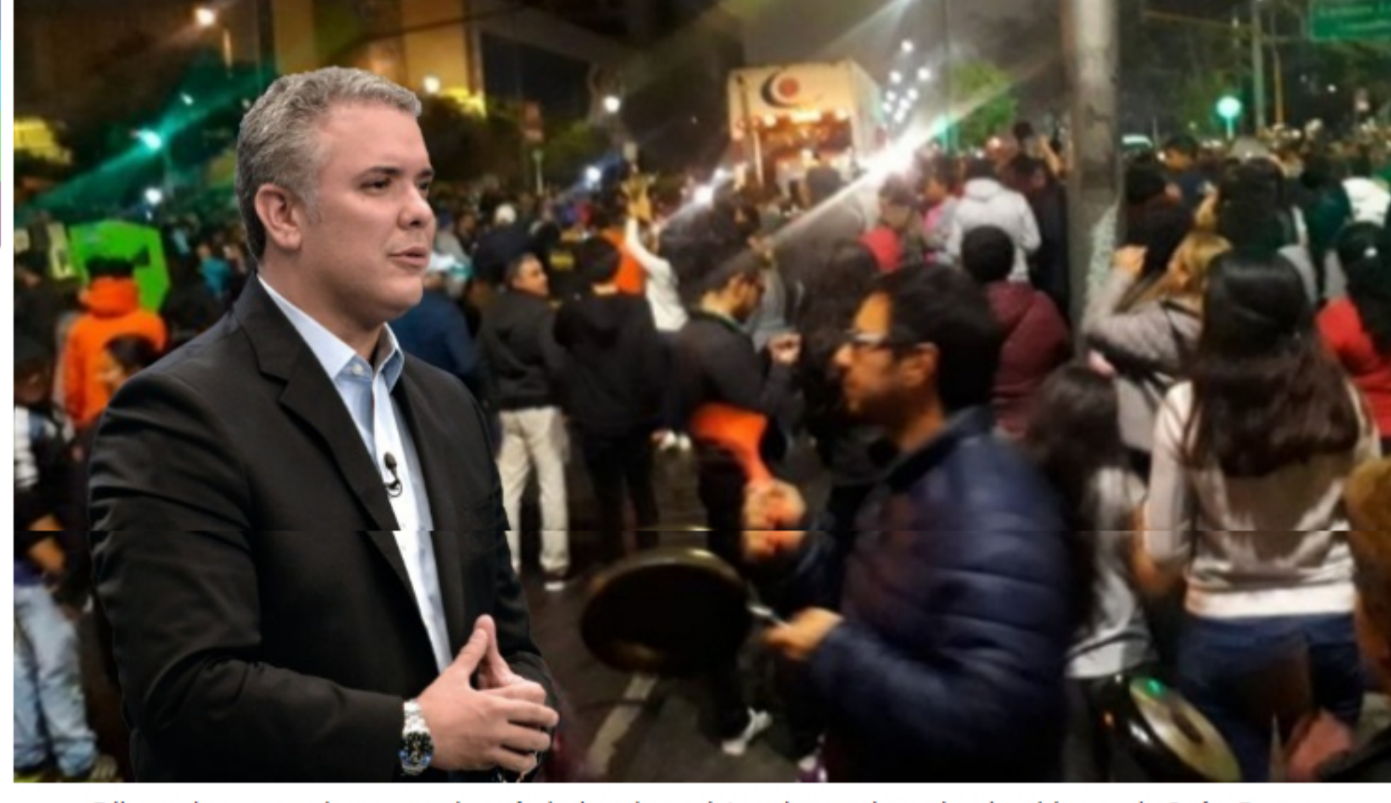
Dilan y los cacerolazos son los símbolos de resistencia y exigencia al gobierno de Iván Duque

Este es un espacio de expresión libre e independiente que refleja exclusivamente los puntos de vista de los autores y no compromete el pensamiento ni la opinión de Las2Orillas.