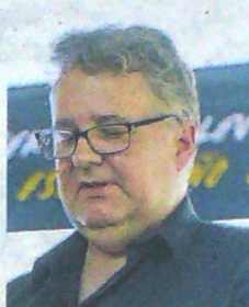
Charle Gamba, presidente y CEO de Canacol Energy.