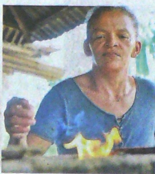
Con leña cocinaban los habitantes de los corregimientos en Sahagún.