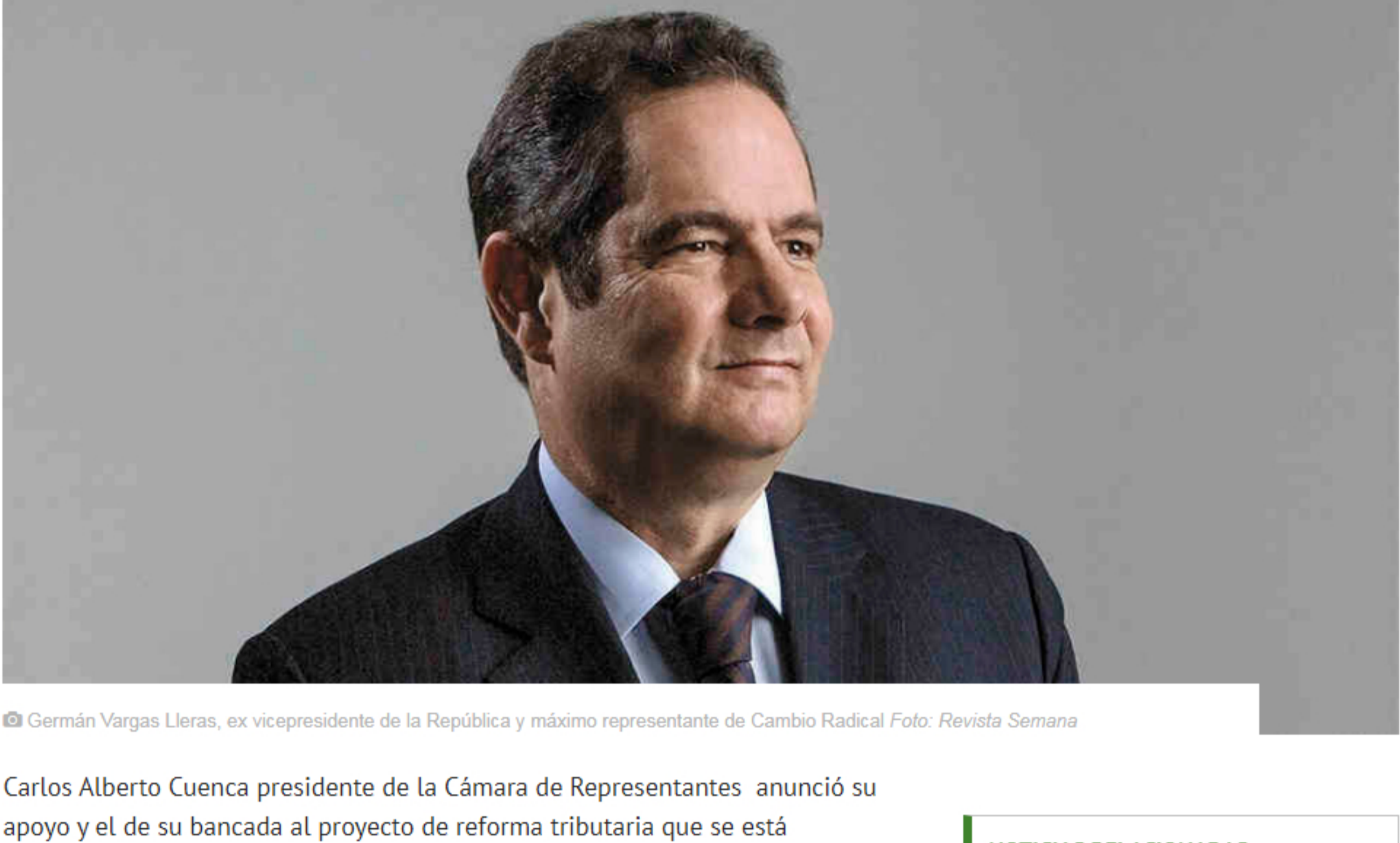
Germán Vargas Lleras, ex vicepresidente de la República y máximo representante de Cambio Radical.

Pese a que los promotores del paro están pidiendo el hundimiento de la Ley de Crecimiento, el reciente apoyo de Germán Vargas Lleras y su partido Cambio Radical podría aclarar el futuro de la Reforma Tributaria.