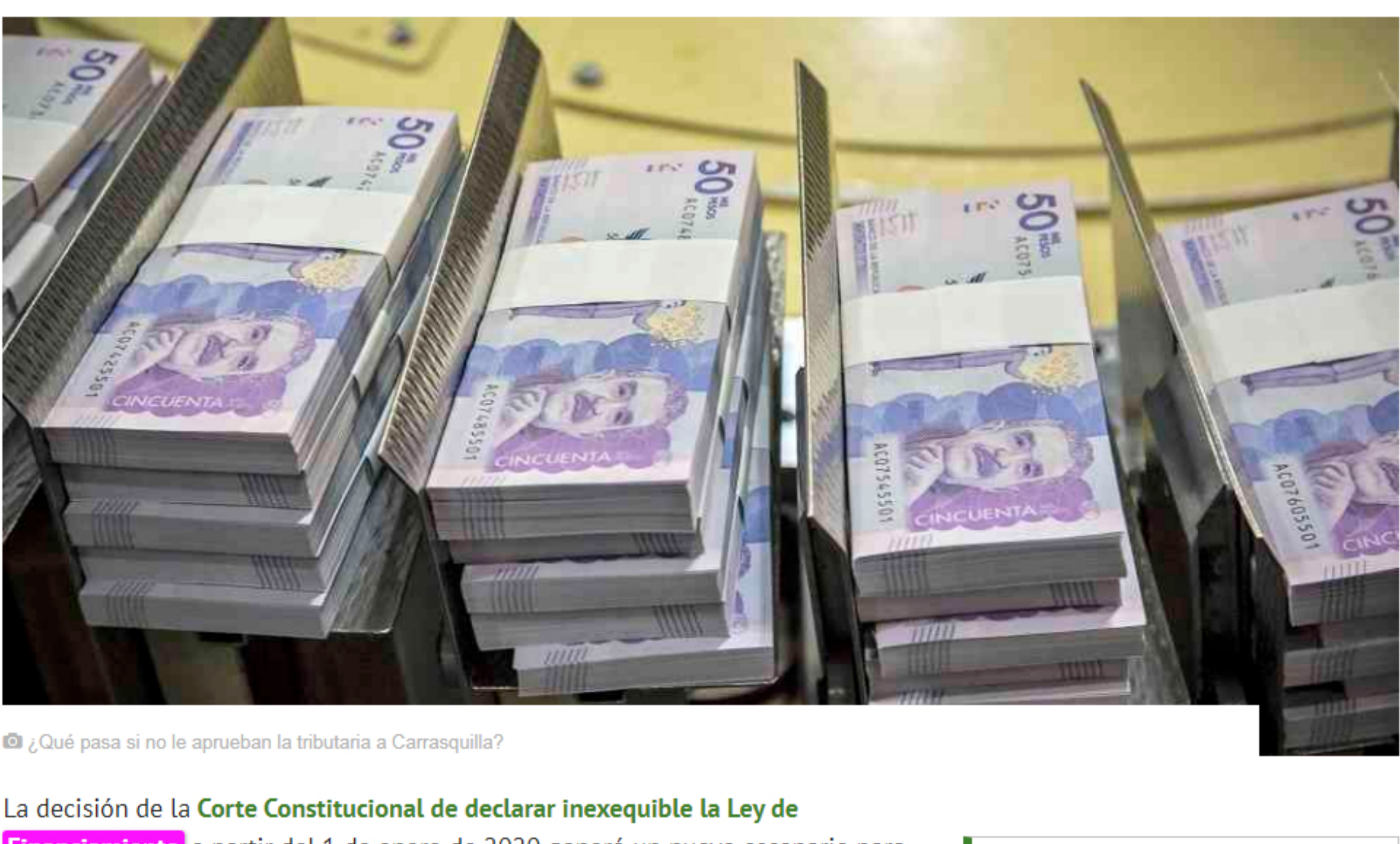
¿Qué pasa si no le aprueban la tributaria a Carrasquilla?