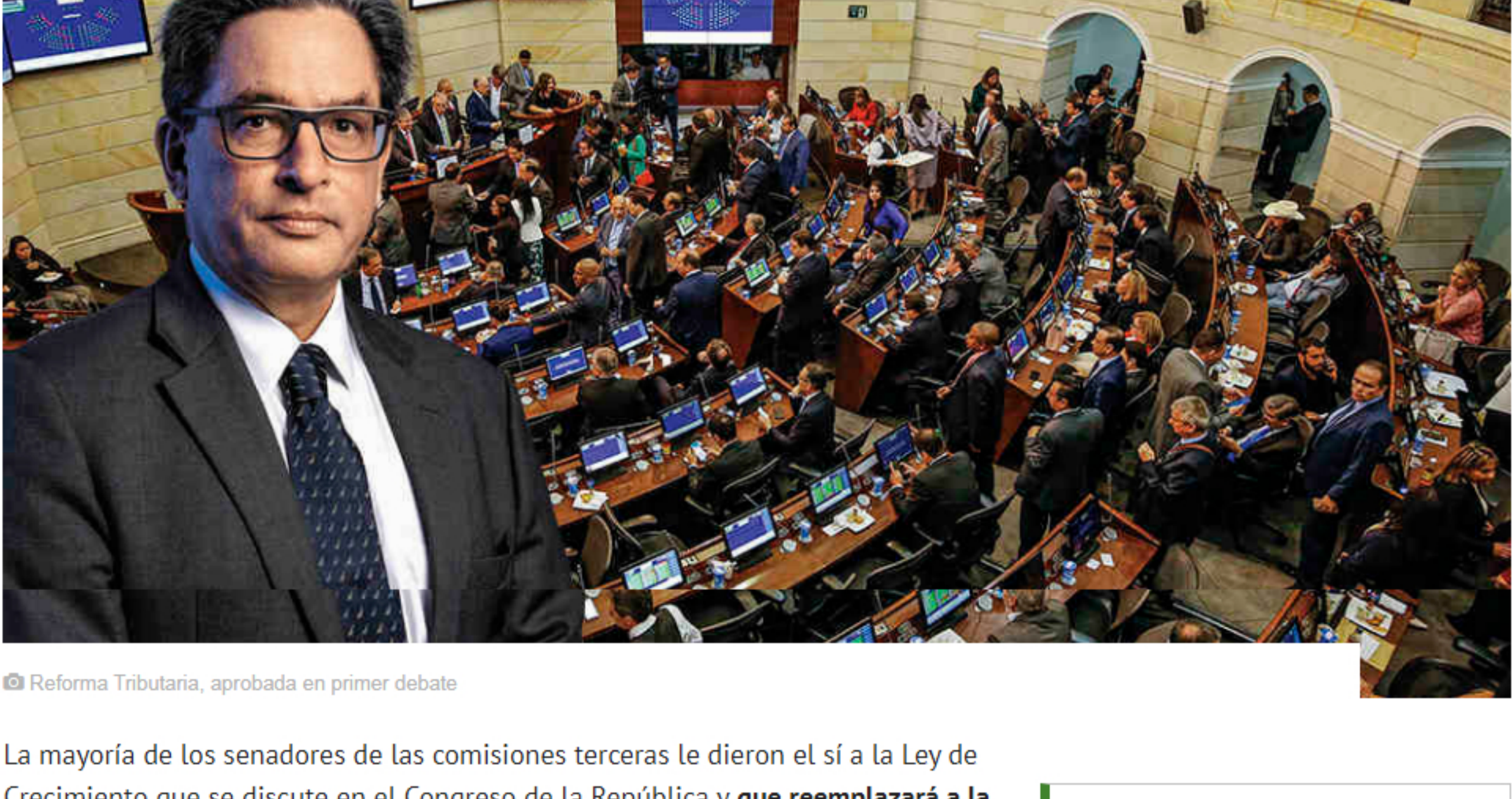
Reforma Tributaria, aprobada en primer debate

Las comisiones terceras de Senado y Cámara le dieron el visto bueno a la Ley de Crecimiento. Ahora la discusión será en plenarias.