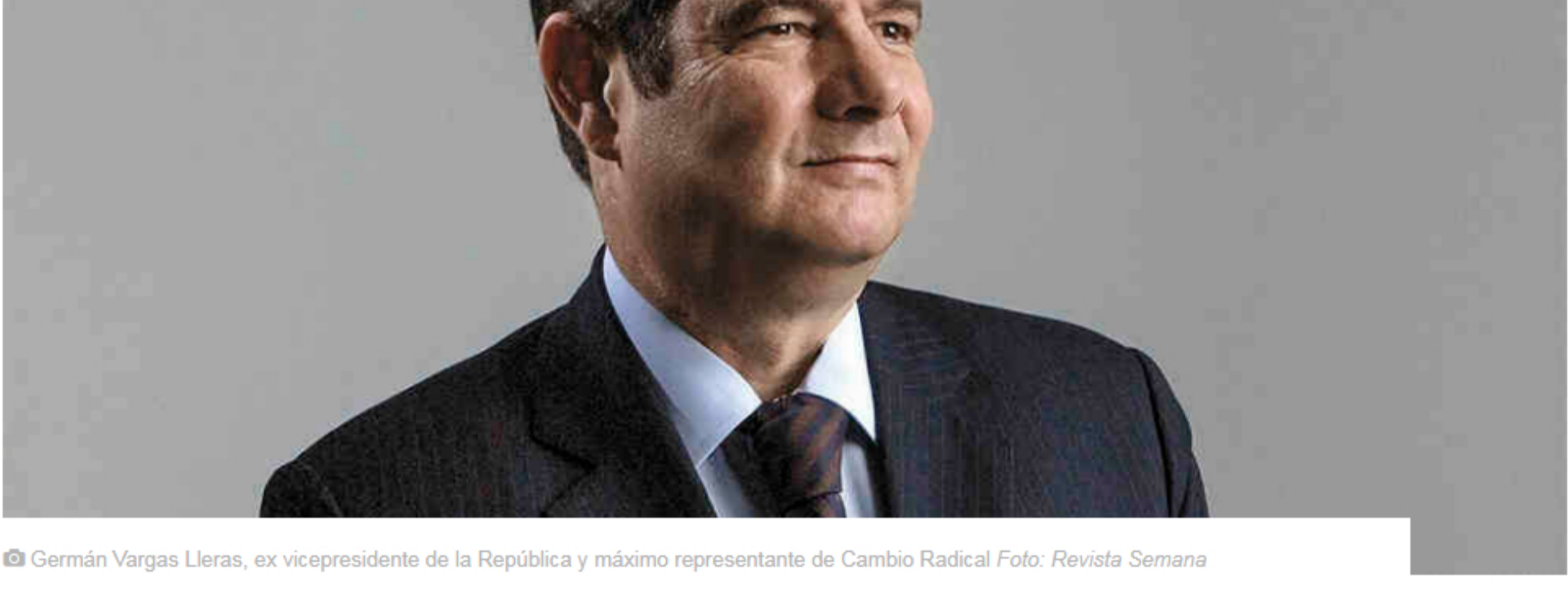
Germán Vargas Lleras, ex vicepresidente de la República y máximo representante de Cambio Radical.