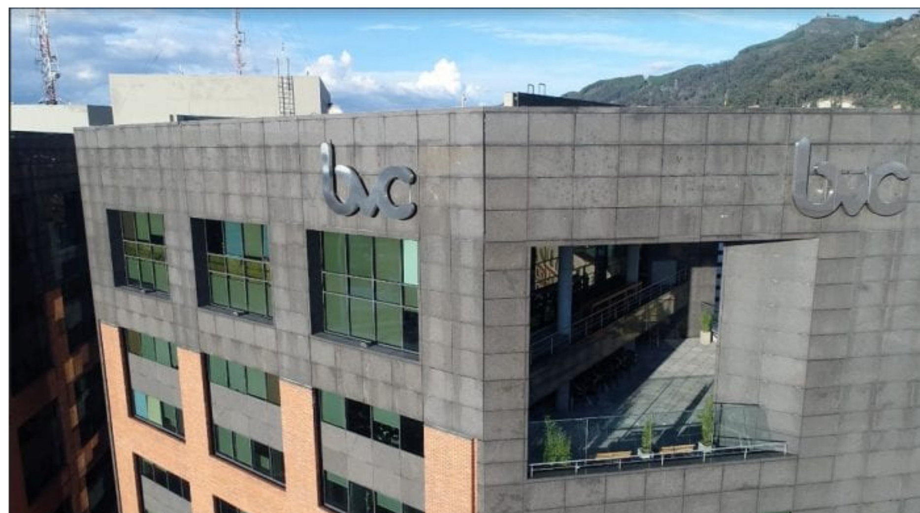
Bolsa de Valores de Colombia

Durante noviembre, la acción de la Bolsa de Valores de Colombia (bvc) fue la de mejor desempeño en el mercado local, ya que subió 14,30 %.