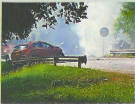
El camión cisterna envuelto en llamas.