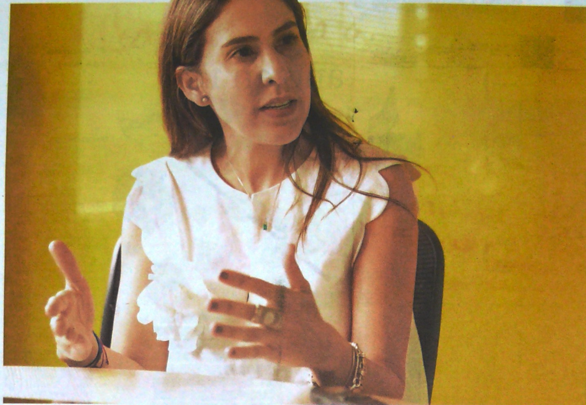
Silvana Habib Daza preside la Agencia Nacional de Minería (ANM) desde hace cuatro años, y apuesta por llevar al sector la revolución tecnológica.

El sector cierra 2019 con inversiones superiores a los US$1.500 millones. Se busca elevar extracción de cobre.