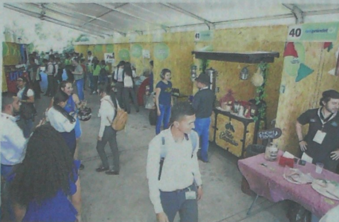
EN LA MUESTRA COMERCIAL se encuentran emprendimientos de todo tipo, desde tecnología, gastronomía, confecciones, calzado, hasta artesanías.

Según Santaella, las marcas nacionales como Fala-