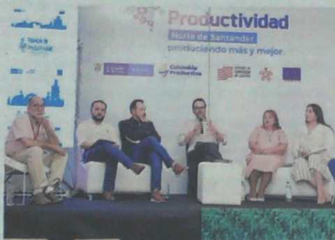
EL LANZAMIENTO DEL PROGRAMA, liderado por Colombia Productiva, se llevó a cabo ayer en la Biblioteca Pública Julio Pérez Ferrero.

Según el ministerio, mientras para una empresa de