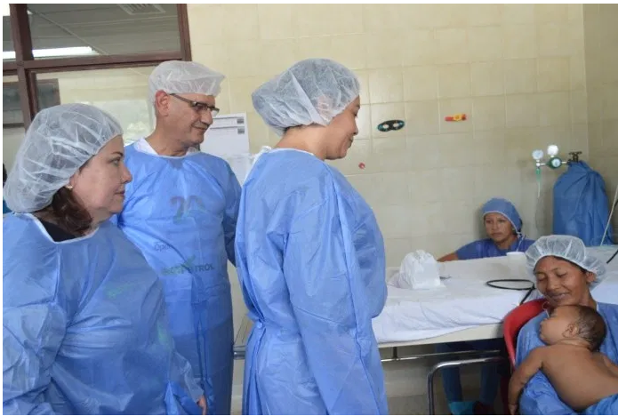
Las cirugías de labio fisurado y paladar hendido son las que mayor se realizan en la Jornada de Operación Sonrisa.

Cirugías de labio fisurado, paladar hendido y otras patologías, fueron realizadas durante la Jornada de Operación Sonrisa, que se llevó a cabo en el hospital Nuestra Señora de los Remedios de Riohacha.