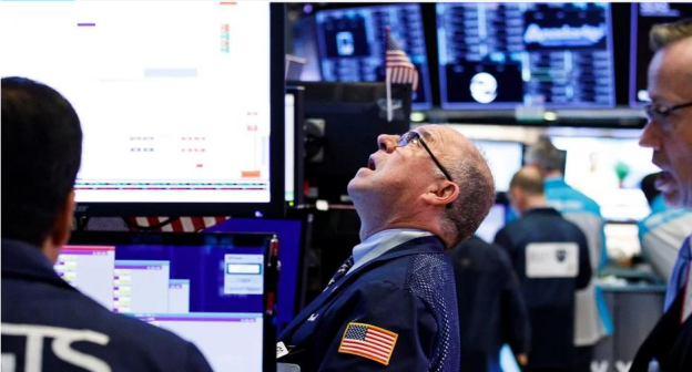
Bolsa de Nueva York.