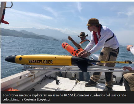
Los drones marinos explorarán un área de 10.000 kilómetros cuadrados del mar caribe colombiano.

Entre agosto y diciembre de este año empezarán a funcionar cuatro 'drones' acuáticos que recorrerán 10.000 kilómetros cuadrados del mar caribe colombiano.