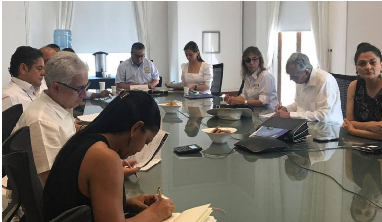
Consejo Gremial de Bolívar

El inicio del proceso licitatorio sería en el primer semestre de 2020