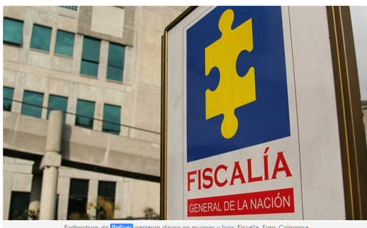
Exdirectivos de Reficar gastaron dinero en mujeres y licor: Fiscalía.

El ente acusador reveló que se llegaron a comprometer 453 mil millones de pesos en gastos suntuosos.