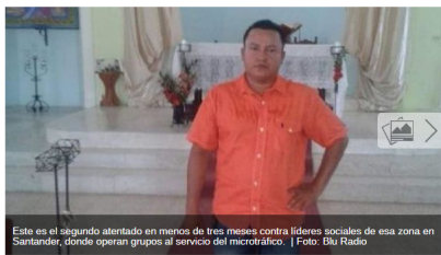
Este es el segundo atentado en menos de tres meses contra líderes sociales de esa zona en Santander, donde operan grupos al servicio del microtráfico.

Publicado 22 agosto 2019 (Hace 14 horas 20 minutos)