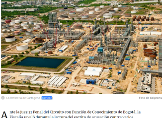
La Refinería de Cartagena Reficar

Ante la juez 31 Penal del Circuito con Función de Conocimiento de Bogotá, la Fiscalía reveló durante la lectura del escrito de acusación contra varios exfuncionarios de la firma Reficar, los hechos que rodearon el escándalo de corrupción en la refinería de Cartagena.