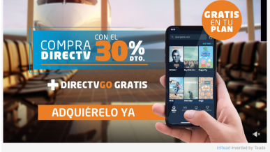
Read invented by Teads