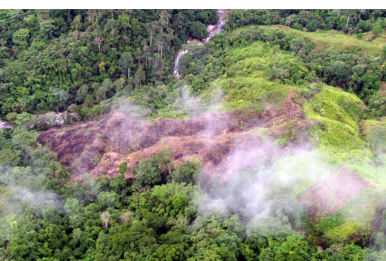
Foto: Deforestación

Según el Plan de Energización Rural del Departamento de Nariño (PERS 2014) el consumo total en kilogramos mes de leña es de 64.167.507, utilizada en el proceso de cocción de alimentos en estufas y hornos. En términos per-cápita, en promedio cada persona consume 113,11 kilos de leña al mes en esta región del país.