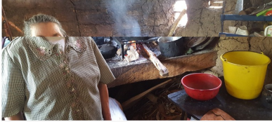
Cocina de leña.

La propuesta se hace ante los altos indicadores de consumo de leña y carbón vegetal entre la población más pobre del departamento