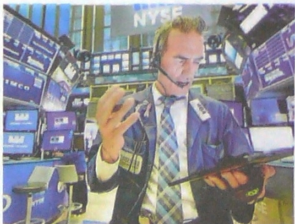
La ‘guerra comercial’ también se siente en las bolsas de valores.

ductos importados, pero finalmente estimula que hay producción nacional. Al final el que gana es el país con un dólar apreciado. Creo que mientras exista esta guerra comercial el precio del dólar se mantendrá en el nivel que está,