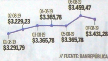
Tasa Representativa del Mercado (TRM) - Agosto 2019

sería la cotización del dólar al cierre de 2019, según las estimaciones de BBVA Research.