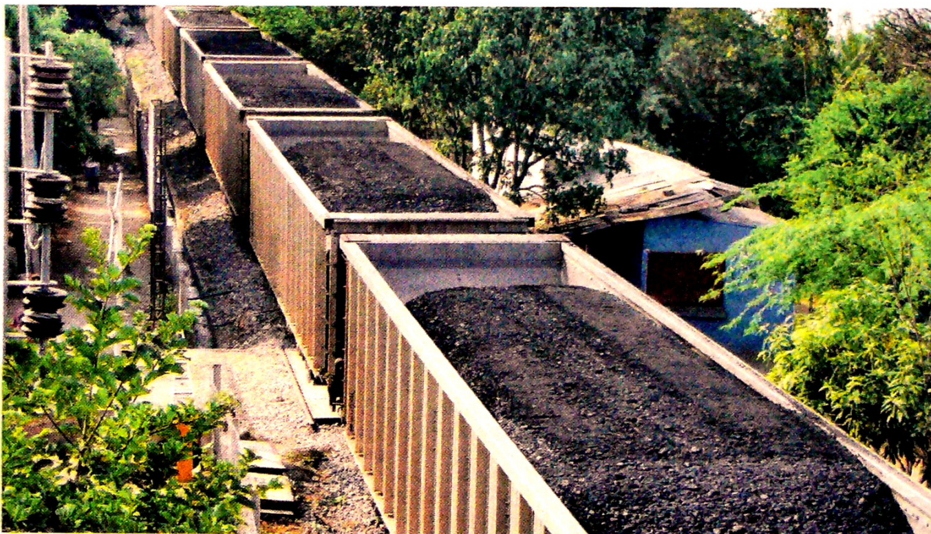
Los municipios en donde se exploten los recursos naturales no renovables tendrán una participación adicional del 5%. CEET

“El Proyecto deberá surtir una segunda ronda de cuatro debates en donde deberá ser aprobado por mayoría absoluta en Senado y Cámara, y debe terminar antes del 16 de diciembre de 2019, fecha en la cual culmina el periodo ordinario de sesiones del Congreso”, señaló la firma Brigard Urrutia. ☐