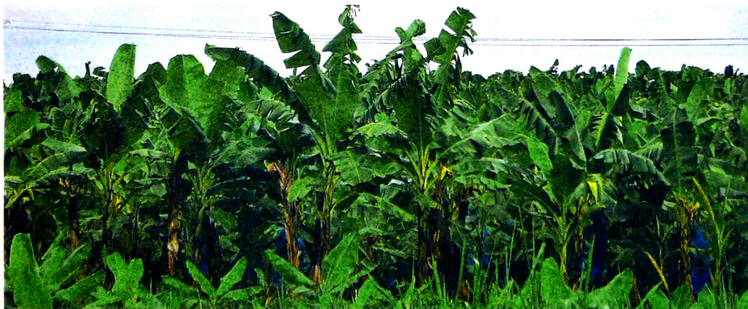
La enfermedad está presente en 175 hectáreas de La Guajira, de las cuales 168,5 ya fueron erradicadas. El resto del país está libre de la peste.