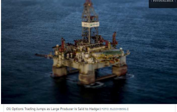
Oil Options Trading Jumps as Large Producer Is Said to Hedge