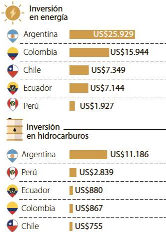
Gráfico: LR, VT

Perú sobresalió por ser el segundo país receptor de inversiones para los tres campos al alcanzar una proyección de US$28.216 millones para este periodo. En cuanto a inversión en minería y en hidrocarburos, dicho país también se vio en el segundo lugar de inversiones, con una proyección de capital de US$23.452 millones para el sector minero y de US$2.839 millones para el de hidrocarburos.