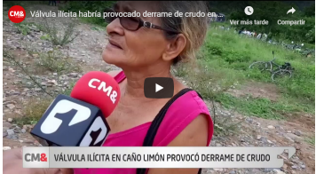
08-Ago-19 Por: Redacción Digital, CM& - Sistema Informativo del Canal 1

La compañía estatal Ecopetrol no ha podido llegar a ríos y quebradas en la zona de Tibú en el Catatumbo donde continúa corriendo una mancha de petróleo , desde hace ocho días tras los ataques a la infraestructura petrolera.