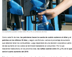
Los aumentos pueden rondar entre 3% y 5% a comienzos de mes

Como cada fin de mes, las petroleras hacen la cuenta de cuánto subieron el dólar y el petróleo en los últimos 30 días y, según una fórmula, cuál es el porcentaje de aumento que deberán tener los combustibles. Luego dependerá de una decisión corporativa cuanto de ese aumento en los costos se terminará trasladando al consumidor. Por lo que trascendió hasta ahora, en los próximos días, las naftas subirán entre 3% y 5% en lo que será el cuarto aumento del 2019.