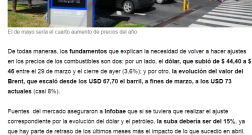
El día de mayo sería el cuarto aumento de precios del año

En este contexto, no sería extraño que la decisión fuese demorar o suavizar los aumentos. De hecho, una de las medidas anunciadas días atrás por el presidente Mauricio Macri fue postergar los aumentos tarifarios del año y fijar el valor de 64 productos básicos por seis meses (los denominados "Precios esenciales").