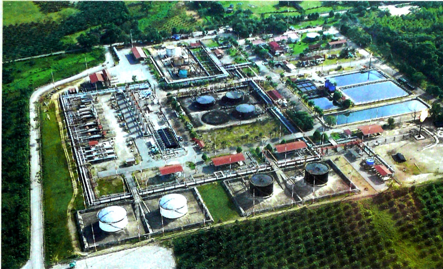
Los mayores precios del crudo favorecerán las finanzas del Gobierno un año después. / Campo Chichemene-Ecopetrol