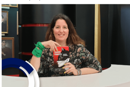
Con esta novela, la escritora busca generar espacios solidarios de relación con los otros a través de la literatura

La escritora argentina llega a la Feria del Libro de Bogotá para hablar de su más reciente novela, con la que logró el Premio Clarín 2017 y la que representa una distopía sobre un mundo donde se autoriza la crianza de seres humanos para que sean el alimento de otros.