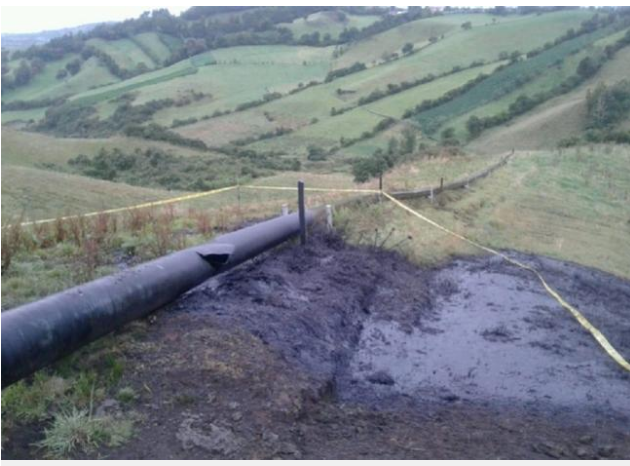
BLU Radio // Oleoducto Trasandino

En lo corrido del 2019 se han registrado siete atentados contra este oleoducto.