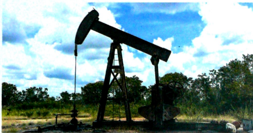
El país vecino ha sufrido apagones en el último mes que interrumpen la producción de crudo.