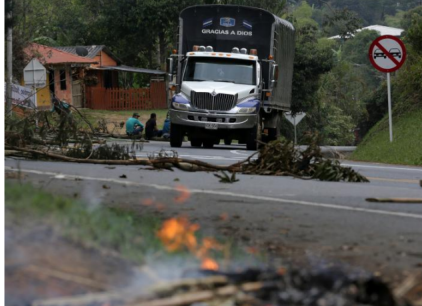
El acuerdo negociado es una concertación sobre el plan de inversiones que debe ser aprobado por una comisión mixta compuesta por representantes del Gobierno nacional y los pueblos indígenas.