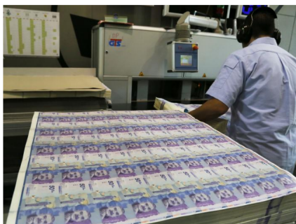
Para el periodo 2021 - 2025 el Grupo Técnico recomendó a US$70

L a construcción del Marco Fiscal de Mediano Plazo (MFPM) del 2019 tendría como columna vertebral un precio del petróleo mayor al proyectado por el Gobierno el año pasado.