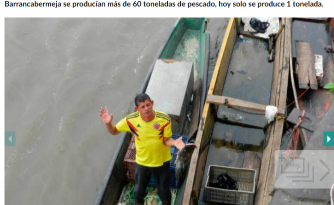
Las 26 asociaciones de pescadores artesanales de Barrancabermeja aseguran que están en crisis, por la dramática disminución del recurso pesquero.

En reunión ordinaria del Consejo Municipal de Pesca Artesanal, pescadores y Umata revelaron que mientras en los años ochenta en Barrancabermeja se producían más de 60 toneladas de pescado, hoy solo se produce 1 tonelada.