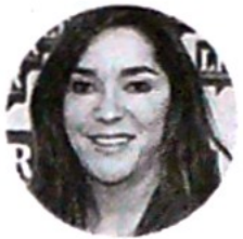
María Fernanda Suárez Ministra de Minas y Energía

“Revivir los argumentos de un informe previo al trabajo adelantado por la Comisión de Expertos, poco contribuye a la discusión que está dando el país en este momento”.