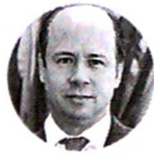
Francisco José Lloreda Presidente de la ACP

Aunque se abordan los posibles riesgos y afectaciones ambientales al emplear el fracking, uno de los puntos que más destacó la Contraloría fueron los estándares de regulación y la limitada capacidad institucional, que se ve reflejada, según ellos, en la adjudicación de bloques que se dieron en la ronda 2014