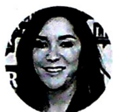
María Fernanda Suárez Ministra de Minas y Energía

“Revivir los argumentos de un informe previo al trabajo adelantado por la Comisión de Expertos, poco contribuye a la discusión que está dando el país en este momento”.