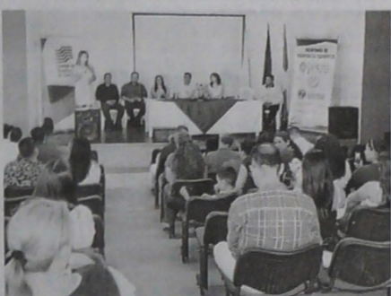
EL PROYECTO DE RECONVERSIÓN laboral liderado por la Cooperativa de Recolectores de Aceite Residual, es avalado por el Ministerio de Minas y cuenta con el respaldo de entes del departamento.