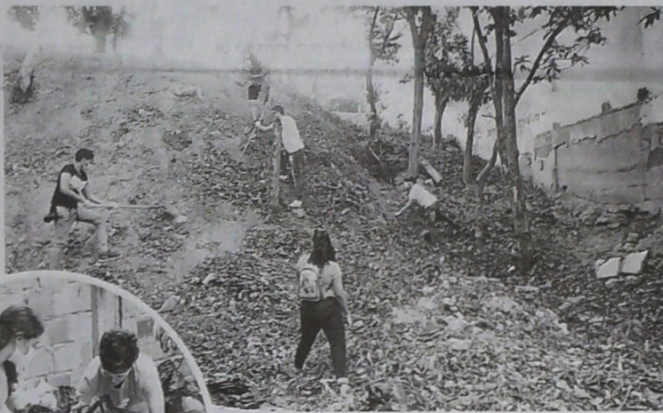
EL SECTOR CONOCIDO COMO BOSQUECITO, en el barrio IV Centenario de Ocaña, fue el espacio escogido para la jornada de limpieza.

“En el municipio hay puntos críticos por contaminación y se requiere de la colaboración de toda la ciudadanía para pasar del activismo en redes sociales y hacer de esas actividades una constante entre la ciudadanía”.