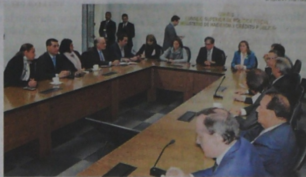
Aspecto de la reunión entre gobernadores de la Región, congresistas costeños y funcionarios del Gobierno nacional, para la presentación de la propuesta.

Puso de ejemplo que "este año vamos a pagar unos $80 mil millones por concepto de las mesadas pensionales, cosa similar el año entrante y al siguiente. Es una obligación muy grande desde el punto de vista de su presencia en un balance, pero relativamente manejable en términos de una obligación por los siguientes 20 o 30 años. Le dificulta más la vida