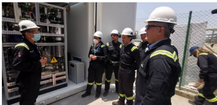
Archivo - Ecopetrol da inicio a la producción de hidrógeno verde en Colombia con un electrolizador de 50 kilovatios (kw) y 270 paneles solares. Archivo (Ecopetrol) / Europa Press

Carlos Gustavo Cano, presidente de la petrolera colombiana en la que el gobierno nacional es el accionista mayoritario, con solo un día después de ser nombrado, después de que el presidente Gustavo Petro haya desaprobado su designación, según el propio Cano.