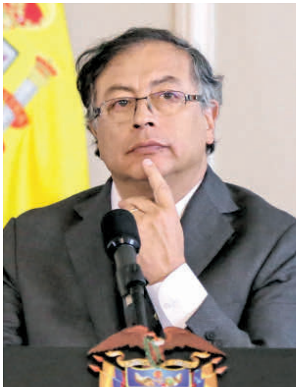
GUSTAVO PETRO Presidente de Colombia