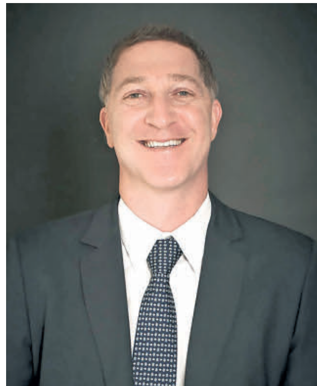
SAÚL KATTAN Presidente de la junta de Ecopetrol