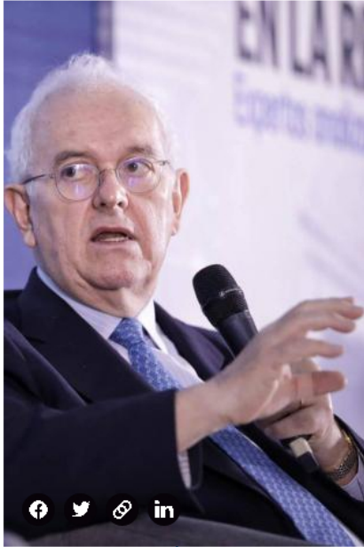
José Antonio Ocampo, ministro de Hacienda.

combustibles fosiles. Los resultados de ello en Ecopetrol comienzan a ser catastróficos, 20.000 millones de dólares en pérdidas... Y de ahí sale la plata para hacer la reforma social. ¿Y cómo entender la contradicción de que mientras el precio del petróleo sube en el mundo, el valor de Ecopetrol baja?