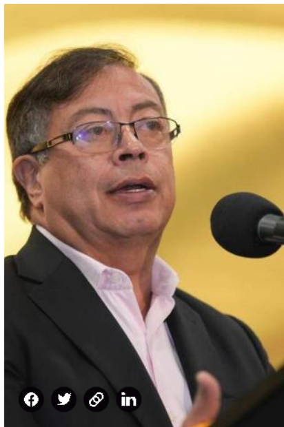
Presidente Gustavo Petro.

Por eso es necesario el acuerdo. Porque si fuera para arrasar, pues no me parece que ese es el mandato. Ni tampoco para pararlo y no dejarle hacer, que sería el otro mandato que no tenemos. Me parece que lo de Petro es buscar soluciones y encontrar maneras de financiar lo que se necesita financiar, y ponernos de acuerdo sobre una agenda mínima.