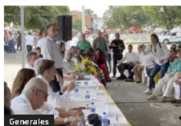
Generales Congresistas de Colombia y Venezuela acuerdan trabajar de conjunto para reactivar la frontera