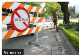
Generales Por evento 'Camina por la Vida 2022': cierres de vías para el domingo 23 de octubre