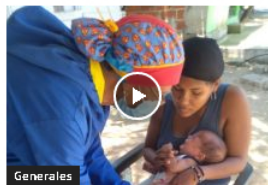
Generales Este sábado, cuarta jornada nacional de vacunación en Barranquilla