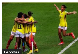
Deportes Colombia ya está en semifinales del Mundial Femenino Sub-17