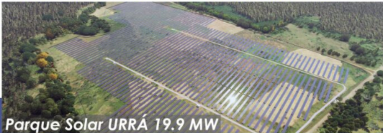
Parque Solar URRÁ 19.9 MW

Avanzamos en la construcción de proyectos solares: