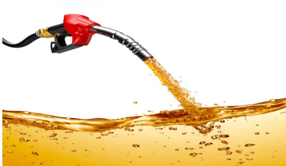
El precio de la gasolina en Colombia terminará el año en 10 mil pesos por galón para muchas ciudades.

Noviembre comenzó un nuevo aumento de precios a la gasolina, en cumplimiento de los anuncios que hizo el Gobierno nacional a finales de septiembre, cuando se indicó que este combustible subiría 200 pesos mensuales desde octubre a diciembre, con lo que finalizará el año sobre los 9.780 pesos, por lo menos en las 13 principales ciudades del país.