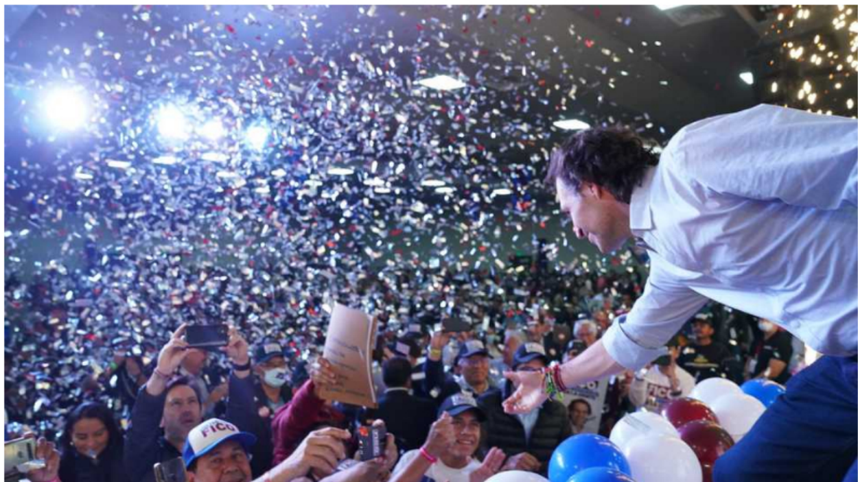
Federico Gutiérrez anunció que luchará contra el hambre.

Este jueves 19 de mayo el candidato a la Presidencia de Colombia, Federico Gutiérrez, en el marco de su campaña electoral de cara a las elecciones del